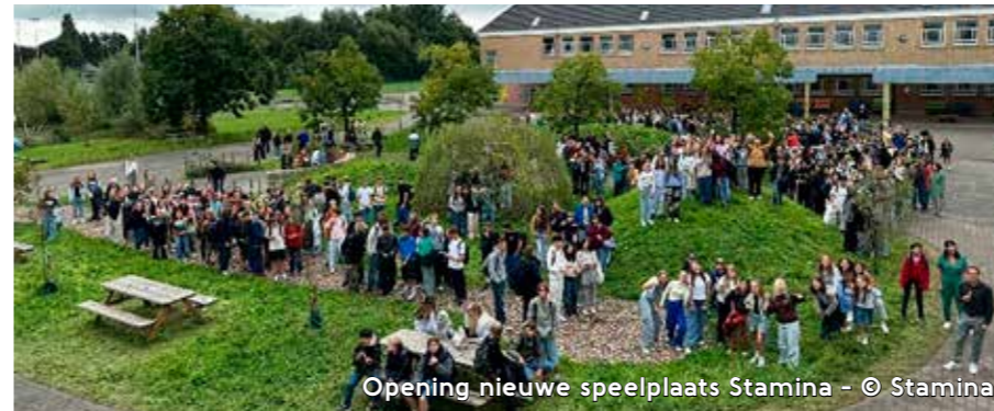
Opening nieuwe speelplaats Stamina