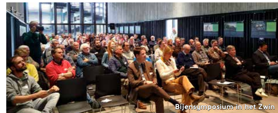
Bijensymposium in het Zwin

Vanuit eigen hoek scoorde ook de samenaankoop 'Jouw tuin zoemt': alle 700 plantepakketten gingen de deur uit, goed voor zo'n 9800 vaste planten.