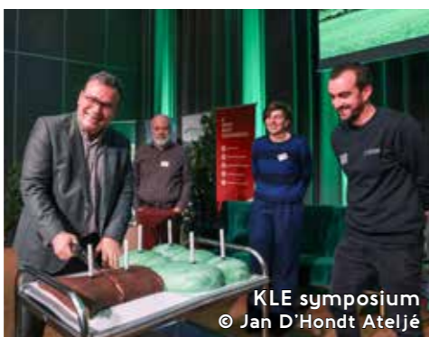
KLE symposium

In 2023 voerden onze landschapsmedewerkers 55 landschapsprojecten uit, waarvan 30 nieuwe projecten, 46 projecten werden uitgevoerd bij particulieren, 9 bij landbouwers. Ongeveer 30 jaar geleden ontstonden de eerste kiemen van wat we nu de 'KLE-werking' noemen (KLE = kleine landschapselementen). Een studiedag op 13 december 2023 kaderde enkele ouder- en nieuwerwetste insteken op KLE. De studiedag was een samenwerking van de Provincie West-Vlaanderen en de vier West-Vlaamse regionale landschappen. De coördinatoren van de Regionale Landschappen Houtland & Polders en Westhoek gaven een lezing. Het symposium trok 126 geïnteresseerden.