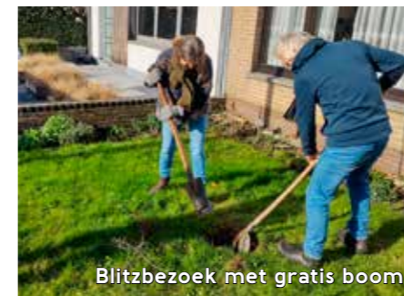
Blitzbezoek met gratis boom

in enkele Brugse wijken kregen tuineigenaars gratis tuintips en een inheemse struik.